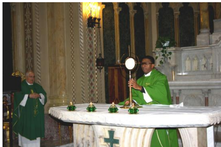
Inizio dell'Adorazione Eucaristica