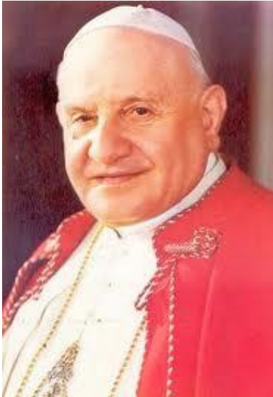
Beato Giovanni XXIII

D omenica della Divina Misericordia (27 Aprile 2014) ci sarà un avvenimento unico nella storia della Chiesa cattolica, la canoniz-