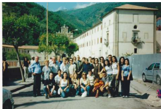
Pellegrinaggio al Santuario San Francesco di Paola