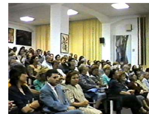
Il pubblico nella sala dei convegni dell'Accademia di Belle Arti di R.C.