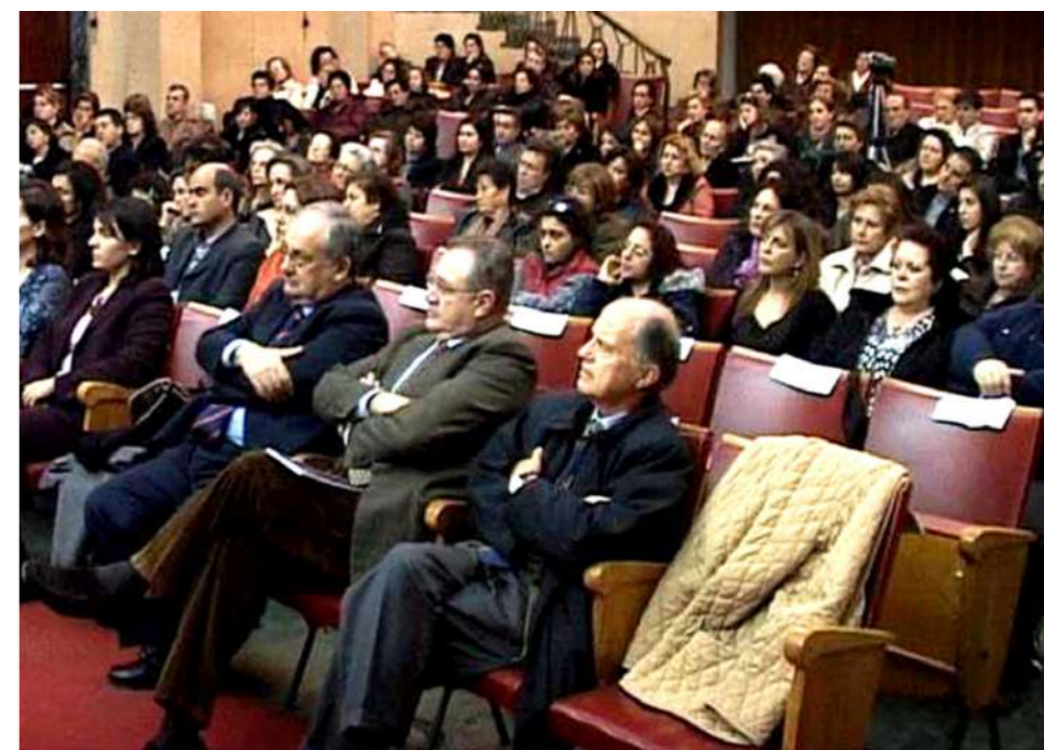
Il pubblico nella sala dell'Auditorium San Paolo dell'Arcidiocesi di Reggio Calabria - Bova

Questo libro, piccolo nelle dimensioni, ma di inestimabile valore per la ricchezza che contiene, ha fornito fin dalla sua pubblicazione e continua a fornire un grande apporto al processo di conversione e di crescita nella fede.