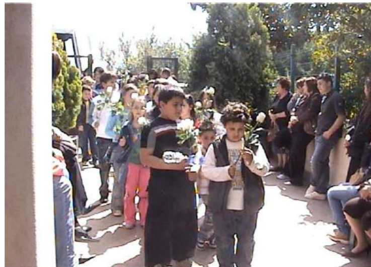
Bosco di Rosarno, Maggio 2007 - I bambini della Scuola Elementare di Taurianova scesi dal Pullmann, si avviano verso la cappellina.

La Convenzione sui diritti dell'infanzia e dell'adolescenza approvata dall'Assemblea Generale delle Nazioni Unite il 20 novembre del 1989 e ratificata dall'Italia il 27 maggio 1991 con la legge n. 176, tutela