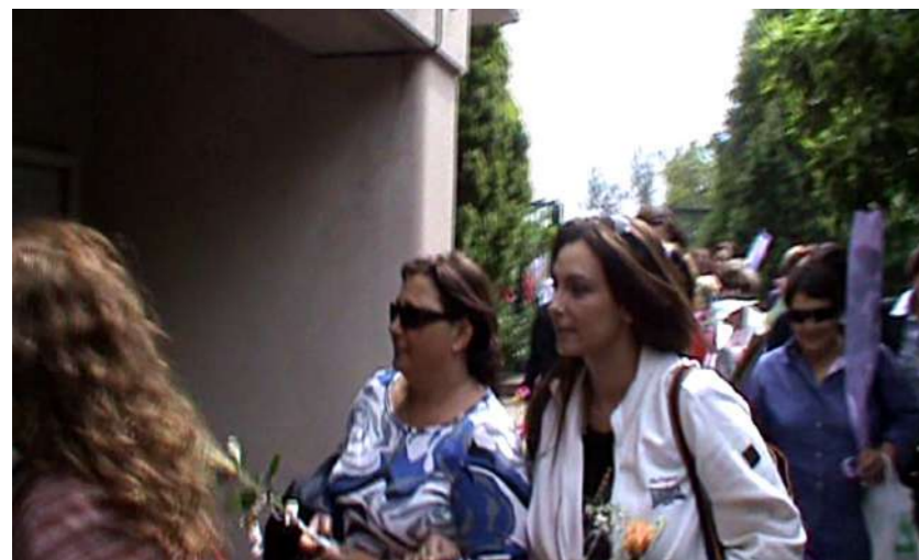
L'arrivo in cappella di un gruppo di pellegrini provenienti dalla Sicilia