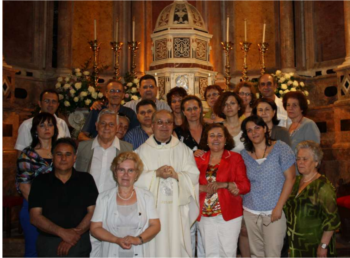
Nella millenaria Cattedrale di Gerace il decennale dell'Associazione "Maria SS. Immacolata Fonte di Grazie"