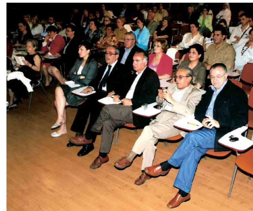
Il pubblico nella sala dei convegni della Casa della Cultura L.Repaci - Palmi

E dunque, nella conoscenza di Dio-Verità, Dio-Amore, c'è la conoscenza della Sua misericordia. Tutti la ricerchiamo e la sperimentiamo costantemente, perché è per essa che viviamo e che siamo portati avanti e continuamente salvati. Che ci venga dato di cantare la gloria del Signore facendo esperienza di una rinnovata conoscenza della Sua misericordia.