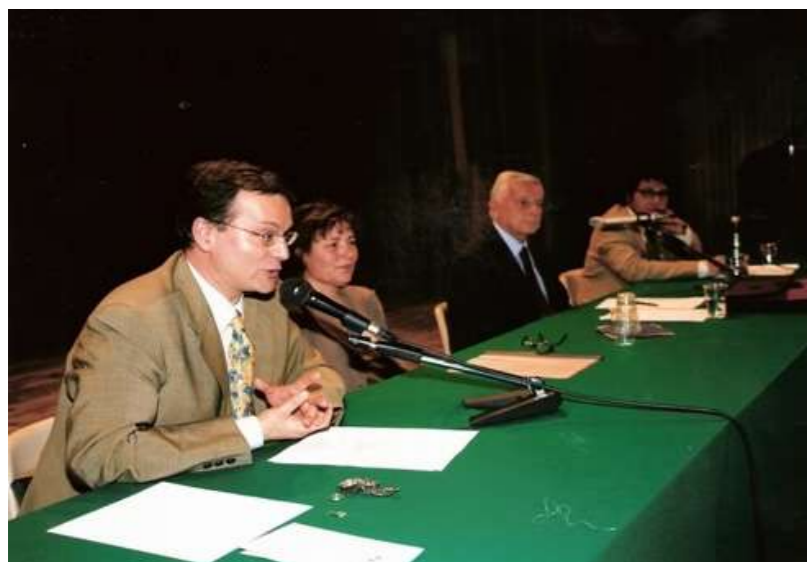
Il tavolo dei relatori