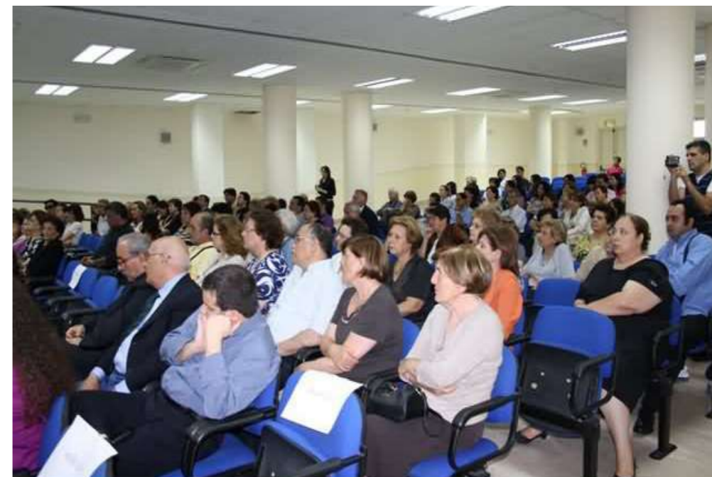
Il pubblico nella sala dell'Auditorium Don Orione, del Santuario di Sant'Antonio di Padova Arcidiocesi Reggio Calabria - Bova

Giovanni Paolo II in un'intervista concessa sull'aereo di ritorno da S.Domingo, a conclusione di una visita pastorale nell'America Centrale, al giornalista che chiedeva cosa può fare l'Europa per questi paesi, ha risposto: "cosa ha fatto l'Europa del suo battesimo", facendo capire che l'Europa deve pensare a non deprecare e annientare.